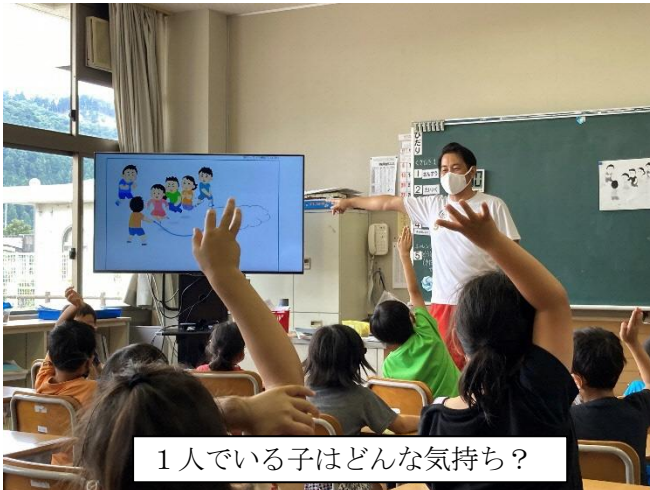
1人にいる子はどんな気持ち？