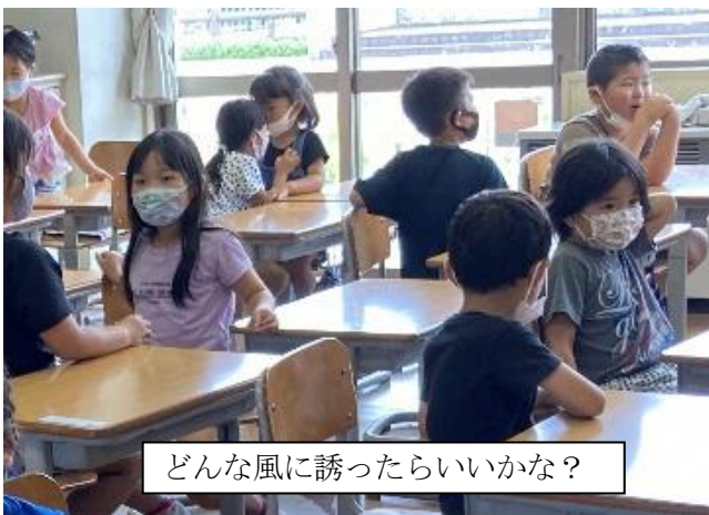
どんな風に誘ったらいいかな？