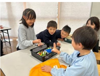
手作りおもちゃで遊びました

1年生は、こども園のお友だちを招いて「秋祭りおもちゃランド」を開催しました。15ものおもちゃコーナーがあるアミューズメントパークが多目的ホールにできあがりしました。ふだんはかわいらしい1年生ですが、自分たちよりも歳の小さい子に接すると、本当に優しい顔つきになります。異年齢での学習は教室の授業とは違う意義があるなと思います。1年生と園児さんたちの笑顔でいっぱいになった「秋のおもちゃランド」でした。