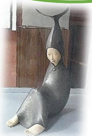
←玄関ホールにある作品

実は、大屋小学校の玄関ホールには、以前ゆずり受けたフォークアートの入賞作品があります。大屋は、身近にすぐれた芸術作品とふれ合える恵まれた地域ですね。素晴らしいです!!