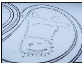
<中庭の雪に描いた 今年の干支>

コロナ禍において「新しい生活様式」が提唱され始めてもうずいぶんとなります。3密を避けること、適切な換気、手洗いや手指消毒の励行、マスクの着用や咳エチケットの留意、不要・不急の外出の自粛など、気遣いも多い毎日ですが、改めて健康でいられることの大切さを強く実感する毎日でもあります。