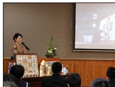
<講話中の華汀先生>