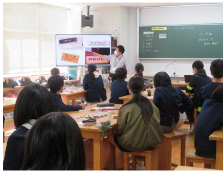
技術「ネームプレート」