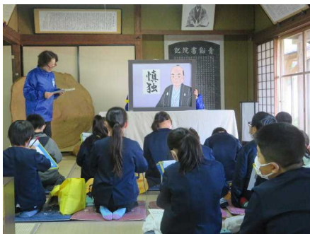
4年 青谿書院・浄化センター見学