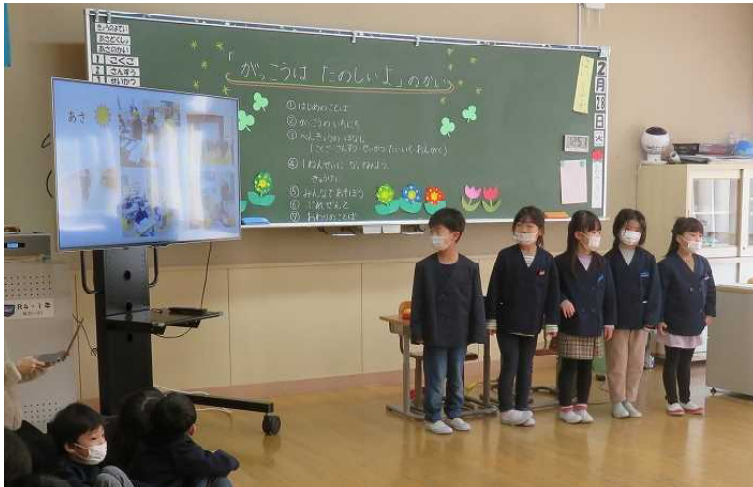
「学校の1日を紹介します」

1年生が新1年生(こども園5才児)体験入学「『学校は楽しいよ』の会」を行いました。