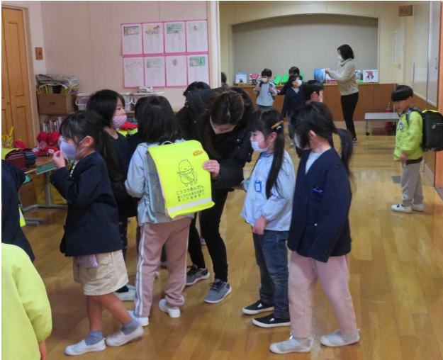
～ランドセルを背負ってみよう！～