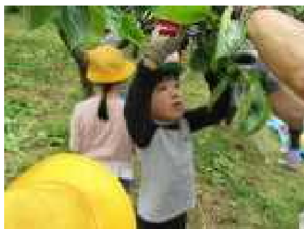
6/9 2年畑ケ中柿畑見学