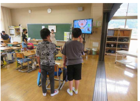
6/8～ 歯っぴーウィーク