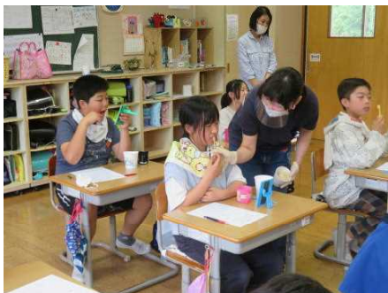
6/8 歯の健康教室 5年

6月8日、第1回学校運営協議会を開催しました。校長より新しい委員の皆様には任命書をお渡しし、学校運営協議会についての説明や今年度の学校運営についての説明を行いました。その後、地域活動・学習支援・見守り活動の3つのチームに分かれて、今年度の活動について話し合いを行いました。委員の皆様には、学校と家庭・地域との連携を深めるコーディネーターや学校運営への評価などでお世話になります。1年間、よろしくお願いいたします。