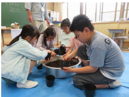
6/8 3年八鹿浅黄豆学習