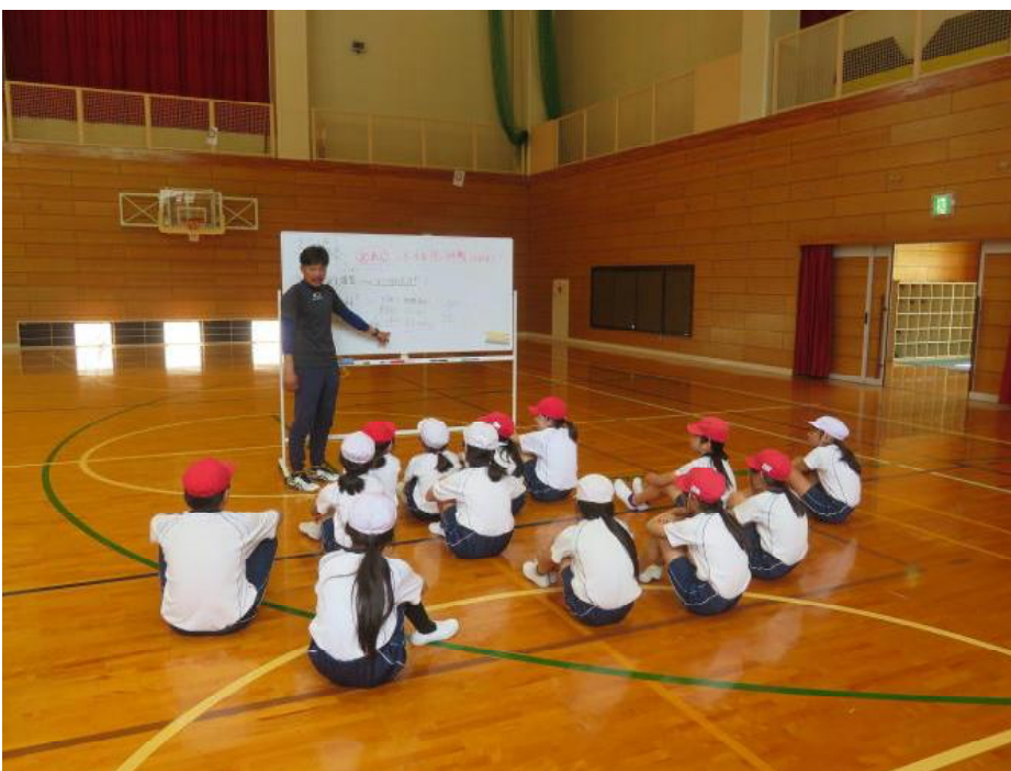
コツを教えていただき、 意欲的に取り組むことが できました。 お世話になりました。