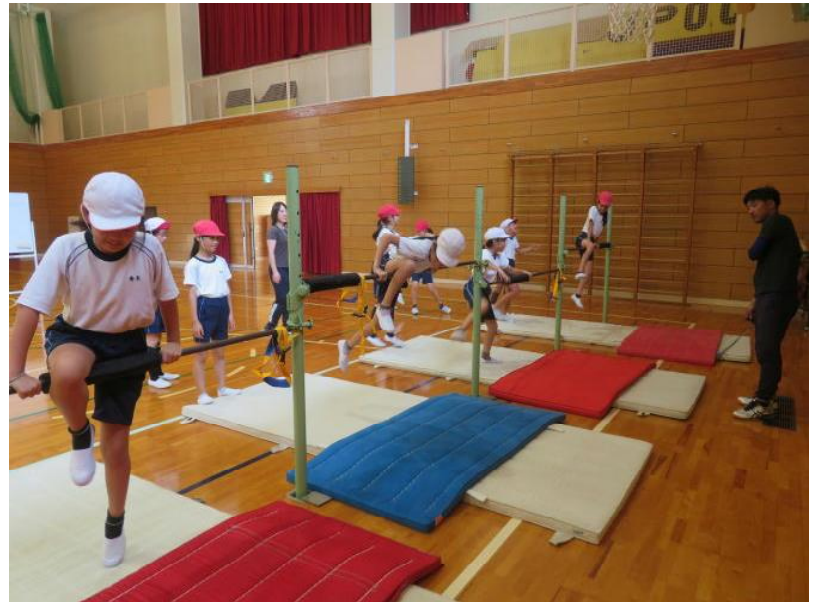
足かけ回りもやってみました。