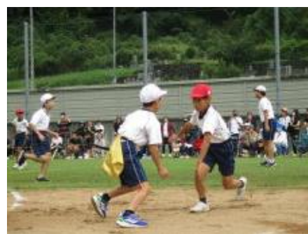
5・6年生 しっぽとり