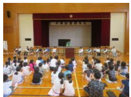
後期児童会役員選挙