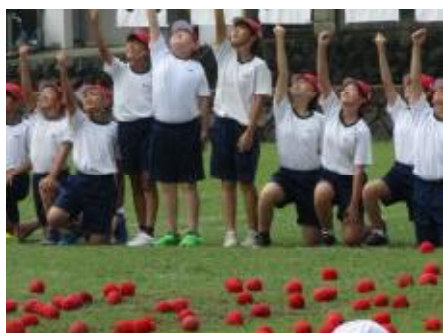
ダンシング！玉入れ

9月23日（月）、令和6年度高柳小学校運動会を実施しました。前日に小学校・地区合同運動会を実施予定でしたが、残念ながら天候不良のため小学校運動会は延期、地区運動会は中止となりました。23日は気持ちのよい秋空の下で運動会を実施できると思ったのですが、途中まさかの雨に降られ、何度か中断したり、プログラムを変更したりすることとなりました。会場にお越しいただいた皆様にも雨の中での見学や待機でご心配をおかけしたことと思います。強く降る時間もあり、途中で中止という判断をせざるを得ないかとも思われましたが、臨機応変の対応により、何とか予定していた全てのプログラムを終えることができました。子ども達も、これまで力を尽くして取り組んで来た練習の成果を最後まで発揮することができ、「力いっぱいやり切った」という達成感を感じていたのではないかと思います。保護者の皆様には、毎日の体操服の用意や熱中症対策の飲み物の準備等、大変お世話になりました。お陰さまで大きく体調を崩す児童もなく、運動会を終了することができました。残暑厳しい中での練習から、時に雨に濡れながらの本番まで、本当によく頑張った子ども達に各ご家庭で多くの賞賛の言葉をかけていただけたことと思います。この運動会で感じたこと、考えたこと、学んだことをこれからの学校生活に活かして行ってほしいと願っています。