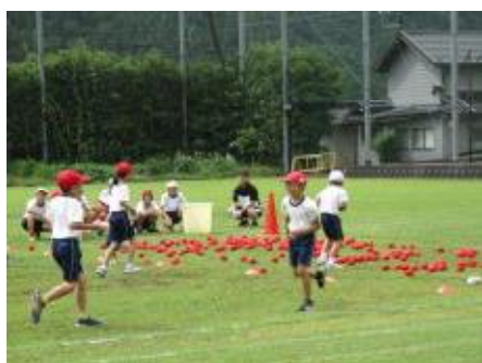
1・2年生 玉取り合戦