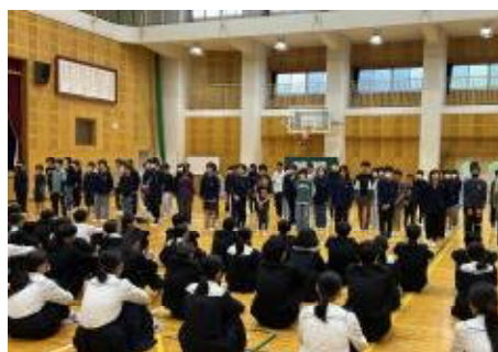
中学校登校「合唱練習」