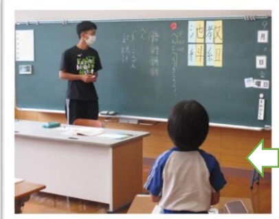
教育実習生初授業