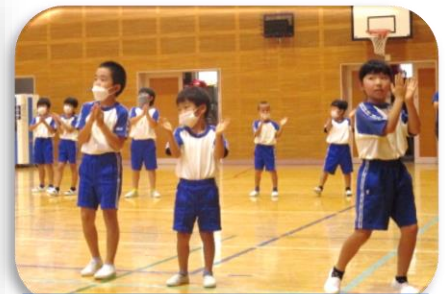
ダンス「陽はまた昇るから」