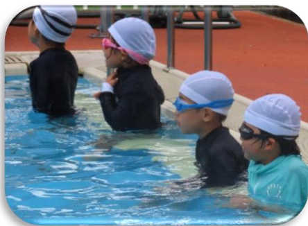
晴れ間をねらって初プール