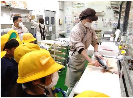
マックスバリュ養父店

広谷小学校、養父小学校の3年児童と一緒に社会見学に出かけました。小規模校の子ども達にとって、このような「小・小連携」の機会は、社会性・コミュニケーション力を育む上で大変重要です。暮らしを守る職業、人々の姿を通して、安全で暮らしやすい社会について考えました。