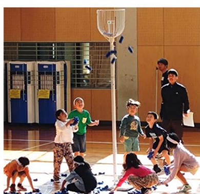
【アジャタ】 A・B両チームとも3分台の好記録