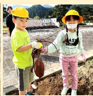
サツマイモ掘り（低学年）