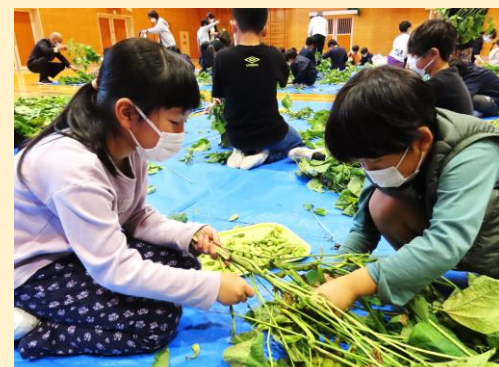
黒枝豆のさやぼり（全校生）

学校以外の場所で、子ども同士や保護者同士が交流する機会をもてるのは、大変貴重なことです。特に、建屋小学校のような小規模校の場合はなおさらです。PTA活動や子連協の活動が活発に行われ、子ども達が生き生きと活動できていることに感謝しています。