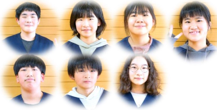
7人の素晴らしいリーダーたち。辛いときも、楽しいときも7人一緒でした。これからも大切な仲間。一生の宝物。