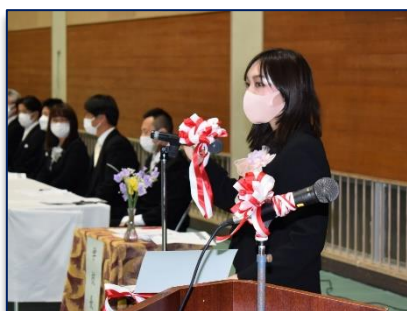
<1組を呼名する担任>