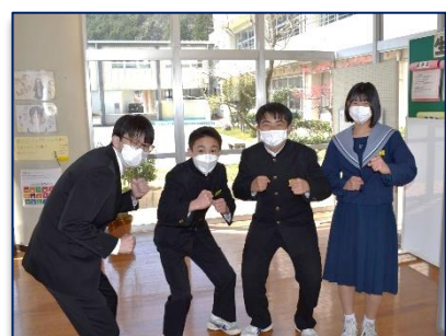
<生徒会役員と担当の先生>