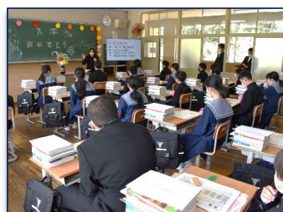
<入学式前の学級活動>