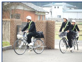
<7日(木)始業式の朝の登校の様子>