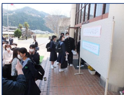
<クラス発表に見入る新入生>

「時を守り 場を清め 礼を正す」は、先生方と生徒の皆さんとの共通実践目標にしています。各教室にも掲示していますので、時折見ても、自らの生活を見直してください。