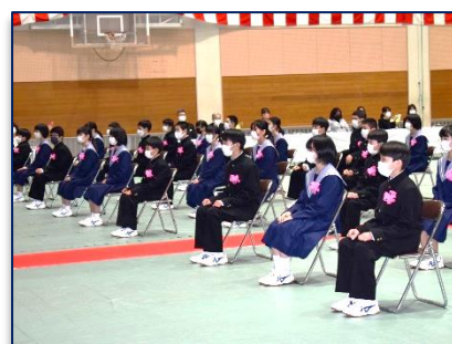
<パリッとした新入生>