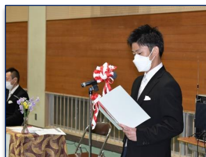
<2組を呼名する担任>