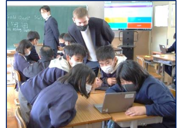
<アダム先生とも仲良し！>

当日は、その質問を踏まえて生徒会役員が中学校生活について説明していくという形式で活動を展開しました。校則については、「校則に違反している生徒にどのように対応するのですか」とか「不要な物とはどんなものですか」、「ストレートパーマはいいのですか」などの質問が出されました。また学習に関しては、「苦手なところなど、分からないところがあったらどうすればいいですか」とか「テストの目標点数はどのくらいがいいですか」、「テスト範囲はいつ頃出されるのですか」といった質問がありました。