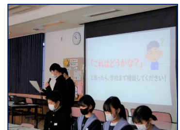
<生徒会役員の説明>

今回で3回目となる「6年生中学校登校」ですが、新しい試みとして、本校の「生徒心得」—いわゆる校則や、中学校での学習の仕方について6年生と本校の生徒会役員とで考え合う時間を設けました。事前に各小学校に配布した本校の「生徒心得」を6年生が読み合わせをし、疑問に思ったことを質問集にしてWeb形式で生徒会本部に返信してくれました。