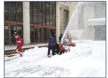
<2台の除雪車でも大変!>

先月25日(水)は前日からの大雪警報の継続に伴い臨時休校を余儀なくされました。朝、校地内に車を入れることもできないほどの積雪状況の中、ひとまず路上に車を止め、雪の中を歩いて除雪機まで行って始動させるものの、あまりの積雪に思うように動かせず思案していたところ、乗用の除雪機で校門入口から駐車場にかけて除雪して下さった方がありました。その時のうれしさと言ったら言葉に表せないくらいでした。その後、学校にある2台の除雪機をフル稼働させながら職員総掛かりで除雪作業にあたりましたが、ほぼまる1日がかりの作業になりました。この作業ができたのも、朝一番に除雪していただいた方のおかげと、職員一同感謝するばかりです。