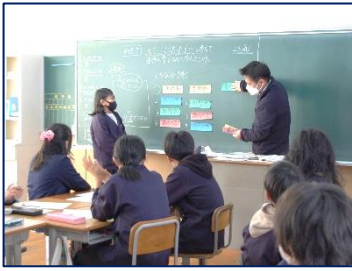
<小学校の先生による算数>

当日は、その質問を踏まえて生徒会役員が中学校生活について説明していくという形式で活動を展開しました。校則については、「校則に違反している生徒にどのように対応するのですか」とか「不要な物とはどんなものですか」、「ストレートパーマはいいのですか」などの質問が出されました。また学習に関しては、「苦手なところなど、分からないところがあったらどうすればいいですか」とか「テストの目標点数はどのくらいがいいですか」、「テスト範囲はいつ頃出されるのですか」といった質問がありました。