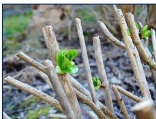
紫陽花の鮮やかな緑

そんな1年生の姿に感動しながらランチルームを後にして 1年生:職業調べ発表会 渡り廊下を歩いていると、ふとあの植え込みの紫陽花に目が留まりました。なんと、新芽というか若葉が出ているではありませんか！