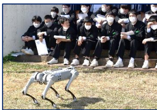
1年:スマート農業研修 養父市農林振興課、 関係の農家様と