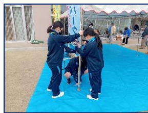
ボランティア部 キッズパークの運営参加 (YBファブにて)