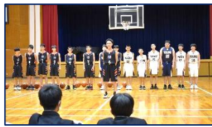
<バスケットボール部>