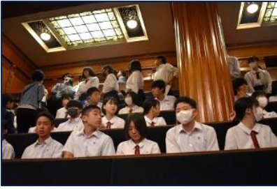
<修学旅行(国会議事堂)>

ます。各行事を通して得た学びを生かし、普段の生活にメリハリを効かせながら、1学期をさらに充実させてほしいと思っています。台風3号が発生したニュースも聞きます。 ご家庭でも、引き続き梅雨前線や台風の動向にご留意願います。