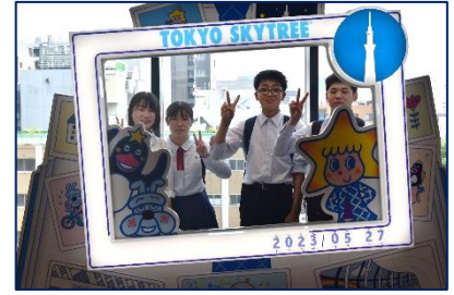
<修学旅行(東京スカイツリー)>