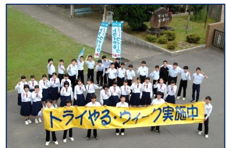
<トライやる・ウィーク(2年)>

このたびの「トライやる・ウィーク」でお世話になっていた各事業所様におかれては、この最終日に生徒たちのためにまとめの活動を用意してくださっていたともお聞きしますし、生徒たちも最終日ならではの気持ちを大切に出勤し、お礼の言葉を直接伝えようと準備していたようです。本当に残念でなりません。