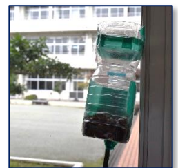
本校お手製のかめむし捕獲器