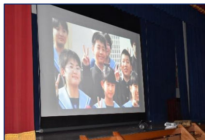
＜メモリアル・ムービー＞