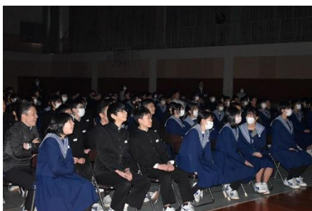
＜ムービーを観て楽しむ3年生＞