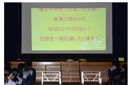
＜ムービーのエンドロール＞