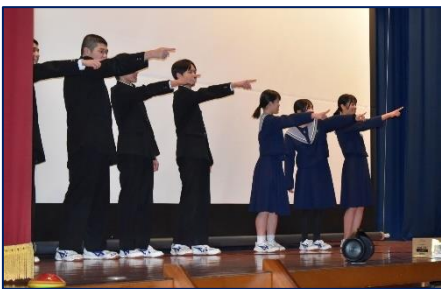
＜生徒会執行部が会長を呼ぶ！＞

明日の卒業式で、しっかりと養父中の愛を伝えとともに、温かく見送り、生徒たち一人一人の未来に向けて、力いっぱいのエールを送りたいと思います。