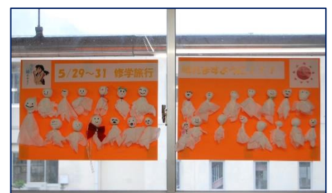
<3年生のてるてる坊主>

明日からの修学旅行。台風1号の進路が心配されます。修学旅行だけでなく、どの活動においても、学校として生徒たちの安全確保が一番の優先事項です。無事に予定どおり活動に取り組むことができますようにと願いながら、天気予報とにらめっこをしています。