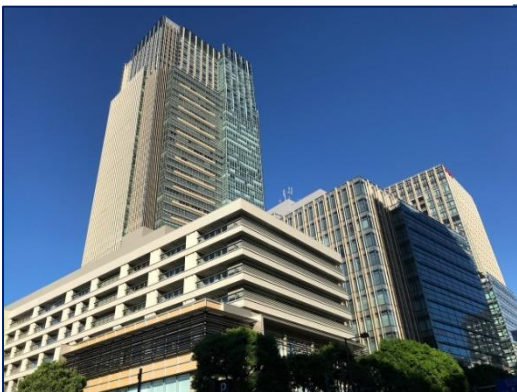
<東京ミッドタウン>