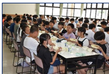
＜ランチルームでの給食＞