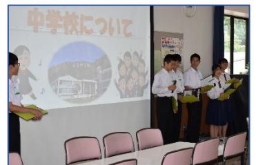
＜生徒会による学校紹介＞