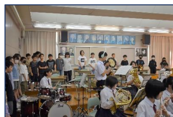
＜部活動見学:吹奏楽部＞