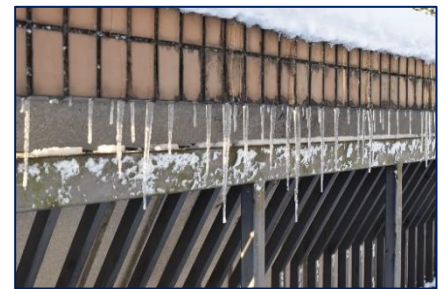
<2/6(木)の朝 校門のつらら>

これからどんな生き方をしていくか。どんな生き方を「望ましい」とするのか。「入試」に挑むこの時期を、勉強もさることながら、しっかりと自分自身の強さや弱さを見つめ、よりよく人格形成を果たしていく意義ある機会として役立てていってほしいと、日々、校長室からエールを送っています。