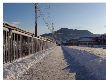
<2/6(木) きれいに除雪された歩道> ありがたいことです。

県内の公立高校の一般入試は3月12日(水)。一般入試のみを受検する生徒の中には、まだまだ先のことととらえている生徒もいるかもしれませんが、その日はまたたく間に目の前にやってきます。人生の大きな節目であるからこそ、「入試」に対して真剣に(時に、七転八倒しながら)日々向かっていってほしいと願っています。そのことが、次の3年間をしっかりと支える基盤になるものと信じています。苦しけれどがんばってやり抜いたことは、必ず自分自身をパワーアップさせてくれるはず。前号でお伝えしましたが、「特にがんばらなかつたけど、結果が出た(合格した)」スタイルだけは避けたいものです。3学期の始業式で話したように、その味を占めてしまうと、今後、まさに踏ん張らないといけない、頑張らないといけない場面において、踏ん張りきれない、頑張れない人になってしまうことが想定されるからです。