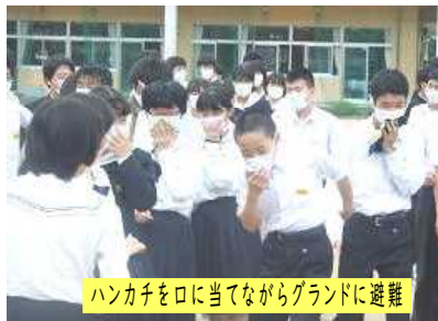
ハンカチを口に当てながらグラウンドに避難

6月10日(金)、避難訓練を実施しました。火事を想定したものです。警報が鳴ってから、グラウンドで避難する生徒たちの様子を見ていましたが、全員急ぎ足で私語もなく真剣に避難行動ができました。「押さない」「走らない」「しゃべらない」「もどらない」という「お・は・し・も」の約束を守って避難できました。静かで迅速な避難行動ができました。実際の火事や地震というのは、いつ・どこで起こるかわかりません。いつどこで起こっても「自分の命を守る」「周りの命を守る」という行動が求められます。避難訓練後には、全校生を対象に消火器の操作実習を行いました。自然災害はいつ発生するか分からないことを念頭に置きながら、引き続き防火・防災への啓発、教育、訓練を行っていきます。以下は事後に取った防災に関するアンケートです。「防災は家庭から」と言います。ご家庭でもアンケートなどをもとに、もしもの備えについて話し合う機会をもっていただきますよう、お願いいたします。