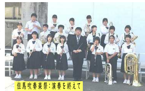
但馬吹奏楽祭：演奏を終えて

但馬吹奏楽祭が開催されました。この演奏会は但馬吹奏楽連盟が加入する中学校、高等学校、社会人の吹奏楽団体が一堂に会して行われるイベントです。当日はハルニレの木(作曲：広瀬勇人)という曲を演奏しました。1年生にとっては中学生になって最初のステージでしたが、2・3年生の奏でる音にしっかりと合わせ、この春から練習を始めたと思えないくらいの素晴らしい演奏でした。部員一体となったステージは輝いて見えました。次は、夏の吹奏楽コンクールです。今回の曲を更に練習してコンクールに挑みます。ご声援をよろしくお願いいたします。