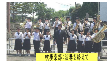
吹奏楽部・演奏を終えて

○合唱コンクールは11月11日(金)午前。場所は「やぶ市民交流広場」(YBファブ)です。観覧は3年生の各家庭1名を予定しています。