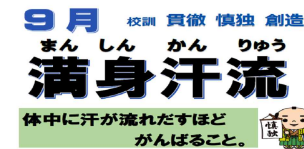
体中に汗が流れだすほど がんばること。

9月は「満身汗流」。全身から汗が流れるくらい、やる気をもって一生懸命に頑張ること。そして、その苦しさを味わうことによって物事に対するやる気を高めることができるという意味です。授業や部活動、何事にも「満身汗流」です。