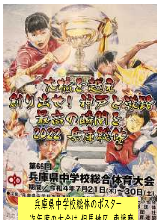
兵庫県中学校総体のポスター 次年度の大会は、但馬地区、東播磨地区を会場に開催される予定です。

夏休み中も兵庫県中学校総合体育大会をはじめ、生徒たちが活躍する場面が多くありました。その結果をお知らせします。県総体当日は大変暑い1日となりましたが、出場選手は本校代表として素晴らしい態度で試合に臨みました。この大会を終え、夏休みから2年生が主体となった新チームが始動しています。今後ともご声援をよろしく願います。