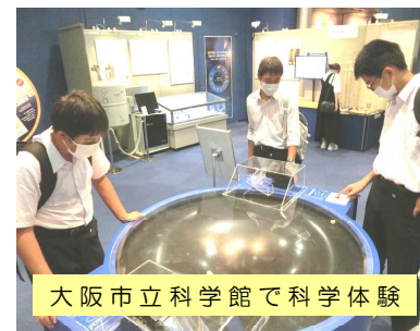
大阪市立科学館で科学体験