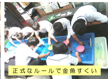
正式なルールで金魚すくい