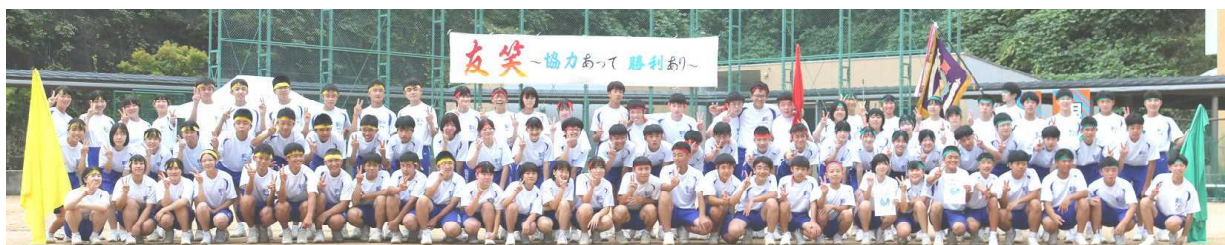
いつも頼もしい3年生:体育祭後はノースイドでお互いの健闘を讃え合う

今年の体育祭は、前日からの雨で開催が危ぶまれ、当日もグランドコンディションはよくありませんでした。朝早くから保護者の皆さまにテント張りや水抜きなどの会場設営にご協力をいただき、お陰様で予定通り体育祭を実施することができました。