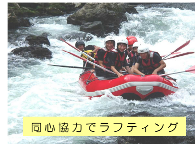
同心協力でラフティング