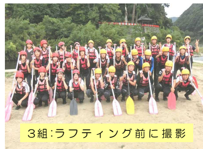
3組:ラフティング前に撮影

9月14日(水)~16日(金)の3日間は、当初の予定日から延期になっていた3年生の修学旅行でした。今年もクラス別にバスでの移動となりました。行き先は京都・奈良・大阪方面です。今年も延期した分、お互いの気心を知れての旅行となりました。「同心協力」を合言葉に「皆の心を一つに、力を合わせてより良い修学旅行にしよう」と取り組みました。常にお互いを思いやり、学ぶときは学ぶ、楽しむときは楽しむ、休む時は休むなどのメリハリがあり、誰もが元気でスローガン「同心協力」を達成できた修学旅行となりました。特に保津川でのラフティング体験や最後に訪れたUSJ(ユニバーサルスタジオジャパン)班行動では、3年生の楽しむ姿、思いやる姿、力を合わせる姿が見られました。次の旅は卒業までの中学校生活です。卒業まで、修学旅行同様にお互いを思いやり、更にお互いを認め合い、高め合い、絆を深める旅をしてほしいものです。修学旅行を終え、3年生はいよいよ各自の進路実現(高校入試)に本格的に向き合うこととなります。