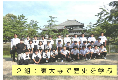
2組:東大寺で歴史を学ぶ