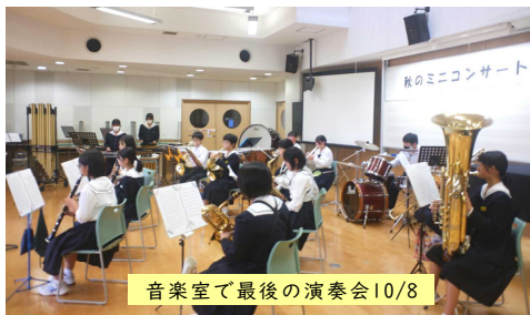
音楽室で最後の演奏会10/8

10月8日(土)、本校音楽室において、吹奏楽部3年生にとっては最後の演奏会を開催しました。本来であれば「養父市吹奏楽祭」に出演して、最後の演奏はYBファブのステージで多くの観客に見守られるはずでした。しかし、台風の接近のため急遽演奏会が中止となり、最後のステージの機会が無くなってしまいました。その代わりに、本校での「秋のミニコンサート」と題した演奏会です。当日3年生は保護者の方を前に、今までの練習の成果を自分の楽器に託して披露しました。いつも過ごした音楽室いっぱい広がる音色は人の心を打つものであり、最後にふさわしい演奏でした。