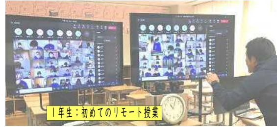
1年生：初めてのリモート授業

校訓の「貫徹」「慎独」「創造」を本校教育の礎にして、様々な取組を行ってきた令和4年も師走を迎え、2学期が本日で終了です。終業式直前の全校生徒登校停止等、コロナ禍で今年もまた学校生活に多くの制約がありましたが、本校生徒の頑張り、PTAの皆様や地域の皆様のご協力ご理解のもと、体育祭等の様々な学校行事、日々の学習活動や部活動で、生徒一人ひとりがお互いに認め合い、高め合い、支え合いながら八鹿青溪中としてのチーム力を高めるとともに、それぞれに力をつけてきたと感じています。