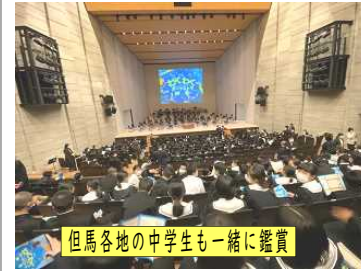
但馬各地の中学生も一緒に鑑賞

12月6日(火)、1年生が、青少年芸術体験事業「わくわくオーケストラ教室」に参加しました。これは、兵庫県が力を入れている体験学習です。本来ならば、「県立芸術文化センター」で行われる行事です。しかし、今年はコロナ禍のため、特別に「YBファブ」で実施されました。1年生は元気いっぱいに出会う人々にあいさつをしながら町内を歩き会場におかいました。70分あまり、本格的なオーケストラの基礎について学び、生のオーケストラの演奏を鑑賞しました。