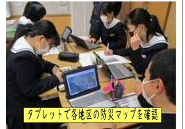
タブレットで各地区の防災マップを確認

11月30日(水)、全校生が地区ごとに分かれて防災学習会を行いました。この学習会は昨年度、気象災害モデル校として取り組んだことの継続です。目的は、①自分たちの地区にひそむ防災上の危険について知る②防災上の危険に対して災害時に備える意識を養う③同じ地区の生徒同士が互いに議論しあい、迫る危険に対する対応策を決定していく④防災学習を通して、災害時に取るべき行動やどのような備えがあると良いかを想像し考える態度を育成することです。学習会では2年生が事前に作成したマイハザードマップ「避難行動判断フロー」を堂々と分かりやすく同じ地区の他学年の生徒に説明し、防災の意識を高めることができました。