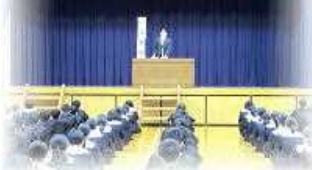
照明が明るくなった体育館での始業式

新年の抱負 新しく迎えた二〇二三年は、僕にとって間違いなく大きな一年になると思います。だから、今年には「新しい自分になること」を目指します。昨年を振り返ってみると、最低限のすべきことはした一年でしたが、悔いが残る一年でもありました。なぜなら、一日の終わりに、その日の自分を振り返った時、「しておけばよかった」と思うことが何度もあったからです。そんな、今までの自分を変えるためにも、今年には「新しい自分になる」をモットーに生活します。 「新しい自分になる」ために頑張ることは、大きく三つあります。まず、人生に影響する重要なものです。三ヶ月後には三年生になり、進路選択があります。これを頑張る必要があり、これまで習ったことの復習も、これから習うこともどちらも疎かにせず、勉強していきたいです。 二つ目は部活動です。僕が心に決めた大会での目標が、達成に向けて、チームで互いに成長し合いたい、最後には「やり切れた」と活き活きと向き合えるようにしたいです。そのために、一日一日の練習を大切に取組んでいきます。これまでで、球拾いなど、小さな事も丁寧に積み重ねて、大きな目標を達成させたいです。 そして三つめが、仕事や役割に責任を持つこと、これが最高学年の三年生になります。色々な場面、学校の中心となっていきます。中心になること、学校全体のことを考えなくてはいけません。周りのこと、学校全体のことを考えなくてはいけません。丁寧に、まず、与えられた仕事や役割を、丁寧に、確実に、しっかりとこなしていきたいです。生徒会長として、学校を創っていくためには、生徒会や生徒全員で考えなくてはならないです。 一年後には振り返った時に、反省して後悔の無い一年にして見せます。そして、昨年とは違うよう、成長した「新しい自分」になっているように、一年間頑張ります。