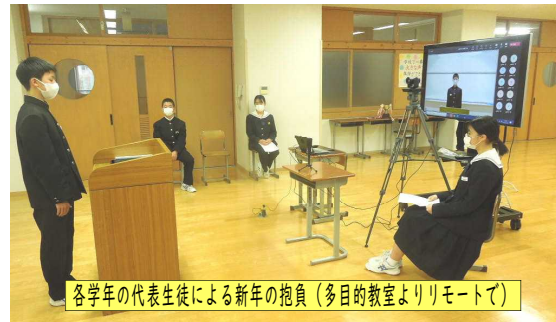
各学年の代表生徒による新年の抱負(多目的教室よりリモートで)

新年の抱負 新しく迎えた二〇二三年は、僕にとって間違いなく大きな一年になると思います。だから、今年には「新しい自分になること」を目指します。昨年を振り返ってみると、最低限のすべきことはした一年でしたが、悔いが残る一年でもありました。なぜなら、一日の終わりに、その日の自分を振り返った時、「しておけばよかった」と思うことが何度もあったからです。そんな、今までの自分を変えるためにも、今年には「新しい自分になる」をモットーに生活します。 「新しい自分になる」ために頑張ることは、大きく三つあります。まず、人生に影響する重要なものです。三ヶ月後には三年生になり、進路選択があります。これを頑張る必要があり、これまで習ったことの復習も、これから習うこともどちらも疎かにせず、勉強していきたいです。 二つ目は部活動です。僕が心に決めた大会での目標が、達成に向けて、チームで互いに成長し合いたい、最後には「やり切れた」と活き活きと向き合えるようにしたいです。そのために、一日一日の練習を大切に取組んでいきます。これまでで、球拾いなど、小さな事も丁寧に積み重ねて、大きな目標を達成させたいです。 そして三つめが、仕事や役割に責任を持つこと、これが最高学年の三年生になります。色々な場面、学校の中心となっていきます。中心になること、学校全体のことを考えなくてはいけません。周りのこと、学校全体のことを考えなくてはいけません。丁寧に、まず、与えられた仕事や役割を、丁寧に、確実に、しっかりとこなしていきたいです。生徒会長として、学校を創っていくためには、生徒会や生徒全員で考えなくてはならないです。 一年後には振り返った時に、反省して後悔の無い一年にして見せます。そして、昨年とは違うよう、成長した「新しい自分」になっているように、一年間頑張ります。