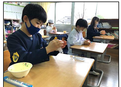
前日の給食で「おにぎりづくり」