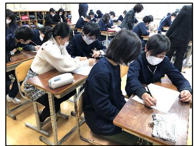
他校の友だちとペア学習

と八鹿青溪中学校入学説明会も開催されました。時間は確実に新しい門出の春に向かって進んでいます。6年生教室には、卒業までのカウントダウンが掲示されるようになりました。小学校生活をしっかりと仕上げていくことが、何よりの中学校への準備です。