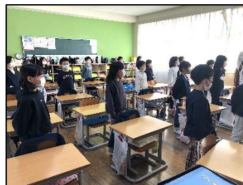
教室で「幸せ運べるように」を歌いました。

また、この日は「震災時の食事の状況を知り、食事への感謝の思いをもつ」というねらいによる「おにぎり弁当日」でもありました。低学年では、事前に自分でおにぎりを作る体験をしました。当日はこの体験を生かして、自分でおにぎりを作った子も多かったです。