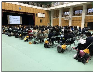
保護者・6年生対象の入学説明会

中学校入学前の6年生にとって、最後の中学校登校になりました。今回も中学校の先生による3時間の授業を受けました。中学校登校も3回目になると、他校の友だちともずいぶん打ち解けてきたようです。話し合ったり、協力し合ったりしながら学習に取り組んでいました。午後からは保護者参観授業