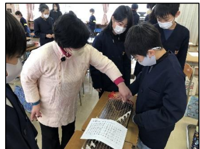
13本の弦を順に鳴らすだけでもなんととも雅な雰囲気です