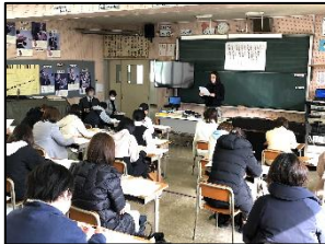
保護者対象の入学説明会