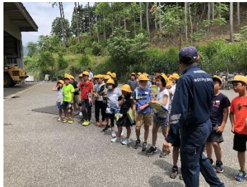
ストックヤードを見学

4年生の社会科では、私たちの生活を支える「ヒト・モノ・コト」について学んでいます。ゴミ処理施設の工夫とそこで働く人たちについて調べました。南但クリーンセンターは私たちの美しい養父市を持続可能にしていくための施設です。私たちが生活を続けていくために働いてくださる人たちがいて、施設があります。持続可能な養父市にしていくために、私たち自身はどうかかわっていけばいいのか、4年生の子たちは真剣に学習していました。