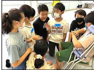
活発なコミュニケーション

江原河畔劇場の俳優さんに講師としてお越しいただき、演劇ワークショップを行いました。コミュニケーションや、集団で合意形成する体験をしていきます。6年生の子たちは、2時間の間、常に生き生き