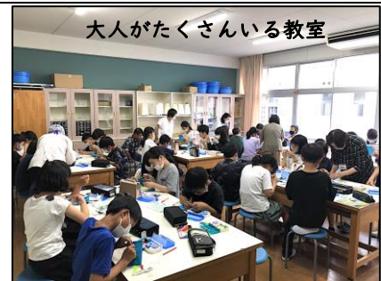
大人がたくさんいる教室

5年生家庭科「はじめてのソーイング」の授業に、地域の方々ボランティアとして支援に入ってくださいました。6月下旬から7月にかけて、計6回、のべ20人の方にお世話になりました。子どもたちに優しく声をかけ、ていねいに教えていただいたおかげで、ひとりひとりに合わせたきめ細かな指導ができました。ありがとうございました。