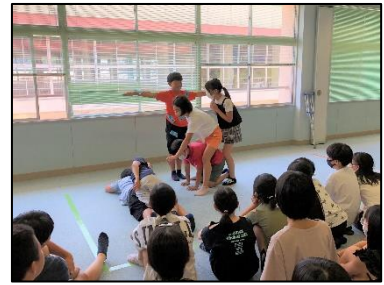
寸劇の発表。このグループのテーマは「クリスマス」

とした活動ぶりでした。反応も良く、じょうずに話し合いができることを講師さんたちもほめてくださいました。短い時間の中で合意形成を図るには「折り合いをつける」ことが必要です。知らず知らずのうちにコミュニケーションの技を使っていることに気づいたり、集団で一つのを創り上げる達成感を味わったりすることができました。今年度は4年生と5年生でもこのワークショップを実施します。