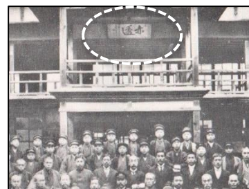
亦透の扁額が見えます