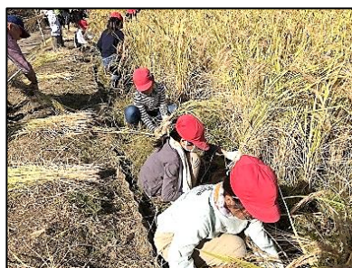
初めての稲刈り体験

10月24日(火)、3年生が赤米の稲刈りを行いました。田植えから四ヶ月半、小佐自治協の皆さんがお世話してくださった赤米田にも実りの秋がやってきました。