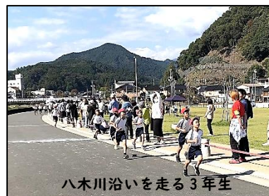
八木川沿いを走る3年生