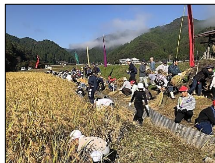
地域の皆さんに支えられた活動