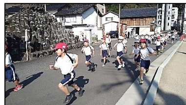
2年生が坂道をかけのぼります

青い空、緑の芝生、地域・保護者の皆様の温かい応援。その中で子どもたちのがんばりがひととき輝きました。がんばることの価値をしっかりと感じて、ひたむきにゴールを目指して走り続ける子どもたちの姿をととてもうれしく思いました。天候も相まって、実にさわやかなマラソン大会になりました。